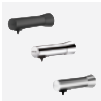
Design: verfügbar in 3 Ausführungen