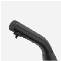
Elektronischer Seifenspender für Standmontage