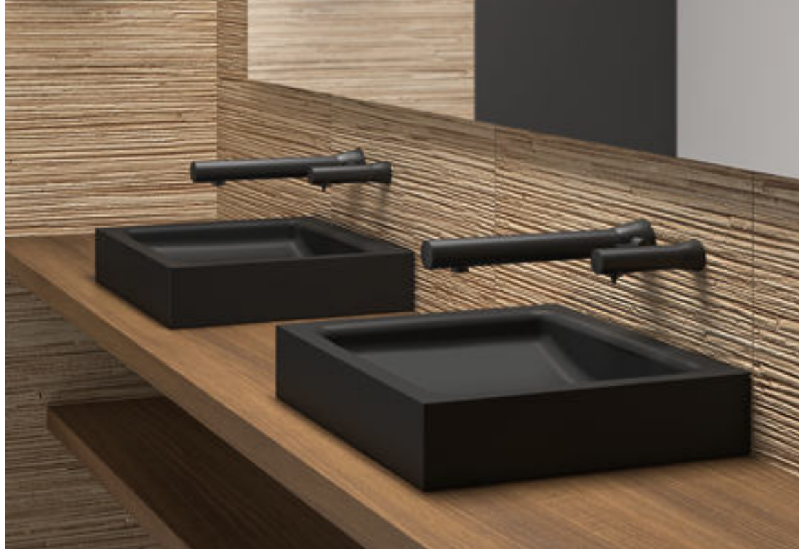
Art. DELABIE: 512051BK

Die DELABIE Gruppe, Experte für die Ausstattung öffentlicher Sanitärräume, vervollständigt seine Produktreihe BLACK SPIRIT mit dem neuen elektronischen Seifenspender in matt schwarzer Ausführung. Seine funktionelle sowie elegante Form macht diesen Seifenspender zu einem Must-Have im öffentlichen Bereich.