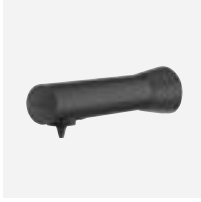
Elektronischer Spender für Flüssigseife oder hydroalkoholisches Desinfektionsgel

Der neue elektronische Seifenspender in matt schwarz